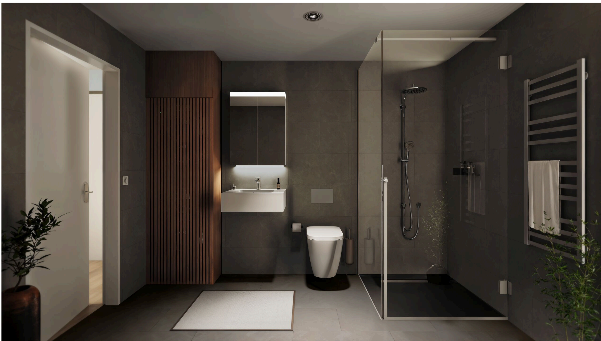
Salle de douche